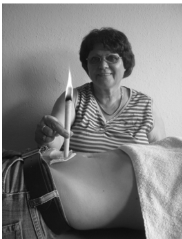
Abb. 11: Anwendung Dickdarm

Die Menschen streben nach Bildung und sind begierig nach allerlei Wissen, sie erwerben diverse Diplome und Zeugnisse, sprechen mehrere Sprachen und wollen die Welt erobern, aber ihre Kenntnisse über sich selbst, ihren Körper, ihre Seele und ihre Gesundheit sind sehr gering. Deshalb sollten sie jetzt danach streben eine neue Sichtweise für das Bewahren ihrer Gesundheit zu erlangen und ihre Selbstheilungskräfte, als auch ihr Immunsystem wieder aktivieren, denn dies macht einen großen Teil der Lebensqualität aus.