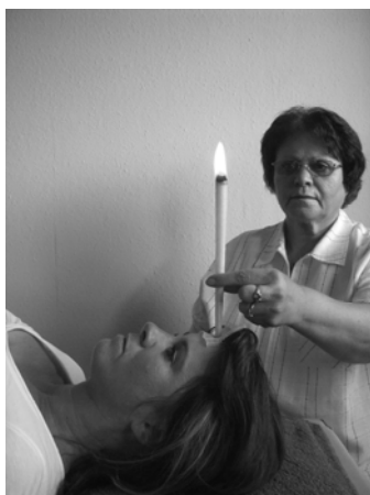
Abb. 9 Anwendung bei Kopfdruck, Migräne, Stirnhöhlenbeschwerden und Chakrenausgleich

Der große Vorteil dieser uralten Methode ist, dass schon lange abgelagerte, trockene, eitrige Reste oder Rückstände (Abb. 17 u. 18) von Medikamenten, Gelenkergüssen, gelöst und abtransportiert werden können und am unteren Rohrand der Kerze haften bleiben.